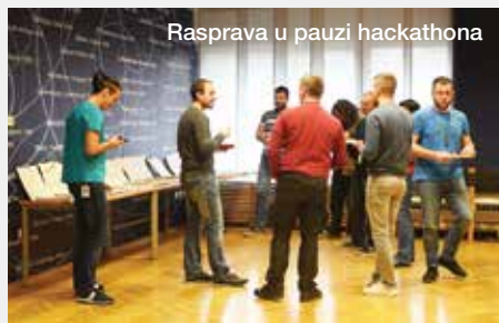
Rasprava u pauzi hackathona