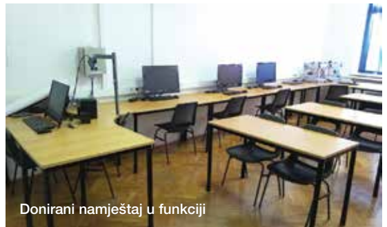
Donirani namještaj u funkciji