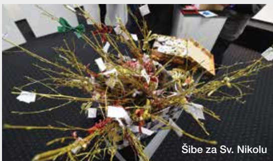
Šibe za Sv. Nikolu