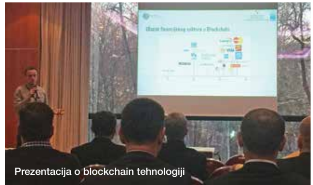
Prezentacija o blockchain tehnologiji

Zavod za sigurnost informacijskih sustava je pod pokroviteljstvom i uz sudjelovanje članova Vlade Republike Hrvatske početkom prosinca organizirao Konferenciju o sigurnosti informacijskih sustava s posebnim naglaskom na domovinsku sigurnost i razvoj digitalnog društva. Na konferenciji je zapaženu prezentaciju pod nazivom "Blockchain - utjecaji nove tehnologije u nastajanju" održao Tomislav Karlović, arhitekt rješenja iz Ericssona Nikole Tesle. Tomislav je prezentirao povijest razvoja blockchain tehnologije, njezin utjecaj na društvo i mogućnosti primjene u razvoju digitalnog društva te Ericssonovo rješenje u ovom području i iskustva s tom tehnologijom.