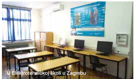
U Elekrotehničkoj školi u Zagrebu