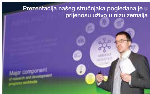
Prezentacija našeg stručnjaka pogledana je u prijenosu uživo u nizu zemalja