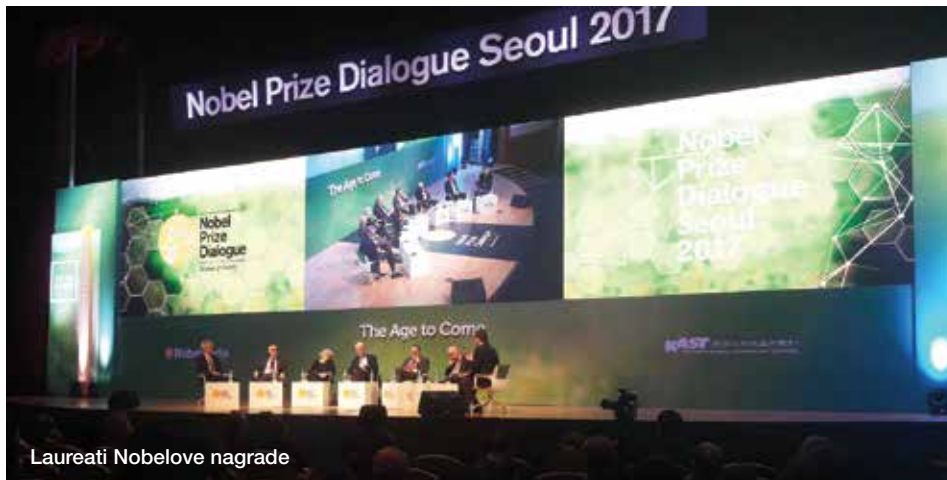
Laureati Nobelove nagrade

Starenje društva, odnosno značajno povećanje udjela starijeg stanovništva u ukupnoj populaciji se, prema UN-ovom izvješću, smatra jednom od najznačajnijih društvenih promjena 21. stoljeća. Gotovo da ne postoji regija ili zemlja u svijetu koja ne osjeća značajno povećanje u broju i udjelu starijih osoba u ukupnoj populaciji. Prema projekcijama, udio starijeg stanovništva u svijetu će se udvostručiti do 2050. godine te utrostručiti do 2100. godine. Također, predviđa se da će u Europi do 2050. godine jedna od tri osobe biti starija od 65 godina. Hrvatska je, kao i ostale zemlje Europske unije, također suočena s izazovima značajnog starenja