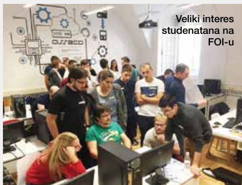
Veliki interes studenata na FOI-u