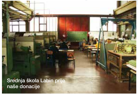
Srednja škola Labin prije naše donacije

Djeca, nastavnici i drugo osoblje su prezadovoljni poboljšanjima u njihovom prostoru, a nama je široka slika ispunjena njihovim slikama prije i poslije donacija. I srce.