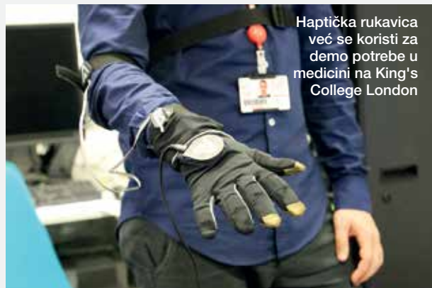
Haptička rukavica već se koristi za demo potrebe u medicini na King's College London