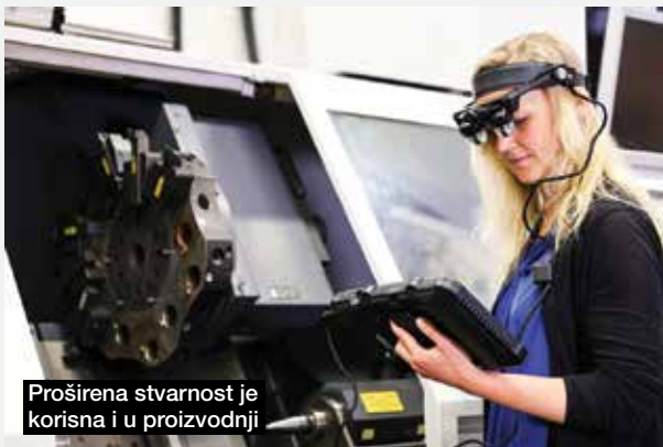
Proširena stvarnost je korisna i u proizvodnji