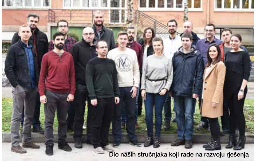
Dio naših stručnjaka koji rade na razvoju rješenja

Razvoj proizvoda je započeo prije godinu i pol u čemu gotovo od samog početka sudjeluju stručnjaci Ericssona Nikole Tesle. Na početku je na projektu radilo nekoliko razvojnih inženjera u Švedskoj i Hrvatskoj. Danas je projekt narastao na veliki broj stručnjaka raznih profila, uz razvojne inženjere tu su i integratori, testeri, dizajneri i arhitekti rješenja. Uz Hrvatsku, stručnjaci dolaze iz Švedske