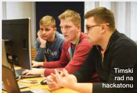
Timski rad na hackatonu

Na zadnjem globalnom hackathonu napravljen je dodatni iskorak u inovativnom razmišljanju: svaki sudionik je mogao predložiti ideju ili postaviti zadatak za suradnju, a područje nije bilo ograničeno na redovno programiranje. Stoga je naziv bio specifičan: Non-Hackathon, no podupirao je korporativnu posvećenost kupcu i njegovim potrebama. Domaći predstavnici, njih devetnaest, predložili su 7 ideja koje mogu značajno poboljšati svakodnevni rad. Timovi se nadaju da će rezultate svog hackathon maratona moći vrlo brzo podijeliti sa svojim kolegama.