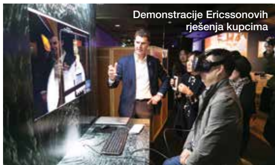
Demonstracije Ericssonovih rješenja kupcima

Sustav inteligentne pomoći u brizi za starije osobe razvijen je s ciljem da pruži dodatnu sigurnost skrbnicima ili članovima obitelji te da im omogući provjeru je li sve u redu sa starijom osobom koja živi sama. Korištenjem naprednih algoritama za strojno učenje, a na temelju podataka prikupljenih s uređaja, sustav može detektirati obrasce navika starijih osoba koje žive same te obavijestiti članove obitelji ako se dogodi nešto neuobičajeno. Sustav se temelji na korištenju jednostavnih uređaja koji su dio standardne ponude gotovo svih rješenja za pametne kuće koje se nalaze na tržištu danas, poput senzora pokreta, senzora klime, senzora za vrata i prozore, pametnih utičnica i slično. Sustav ne koristi uređaje poput kamera ili mikrofona koji bitno narušavaju privatnost korisnika već jednostavne uređaje koji nisu nametljivi, a postavljaju se u domu starije osobe. Za sustav postoji veliki interes te će biti predstavljen i na Mobile World Congressu 2018 u Barceloni sljedeće godine.