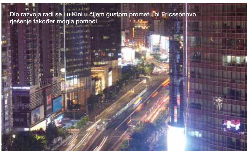
Dio razvoja radi se i u Kini u čijem gustom prometu bi Ericssonovo rješenje također mogla pomoći

Ovaj projekt predstavlja veliki izazov zbog visokog prioriteta u korporaciji, stalno prisutnih novih zahtjeva na rješenje i suradnje međunarodnih timova, ali isto tako i priliku za stjecanje novih znanja i vrijednih iskustava.