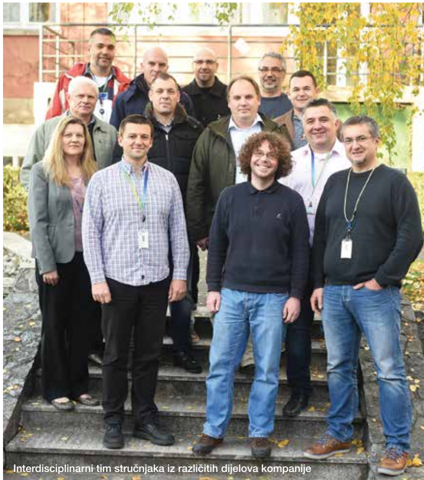
Interdisciplinarni tim stručnjaka iz različitih dijelova kompanije

Ovaj projekt ostvaren je na temelju inovativne ideje naših djelatnika. U Ericssonu Nikoli Tesli imamo veliku raznolikost odgovornosti u raznim područjima te nam ta šarolikost kompetencija omogućuje velike sinergijske učinke. Uz tu činjenicu te marljivost i predanost naših inženjera sigurni smo da nas čeka još mnogo ovakvih uspjeha.