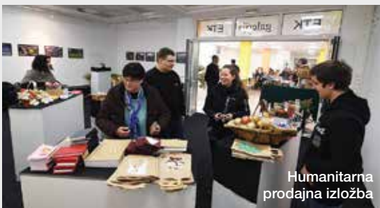
Humanitarna prodajna izložba